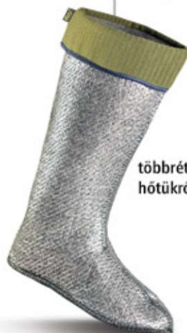
többrétegű csúszásmentes hőtükros bélés