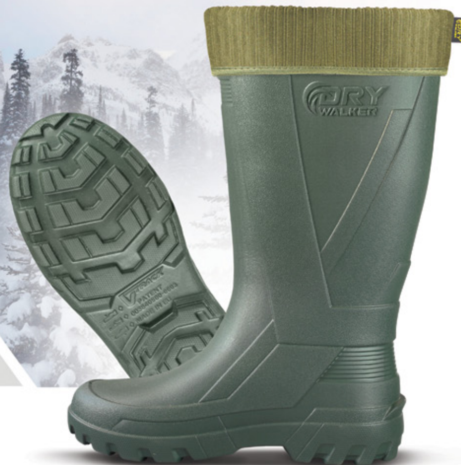
többrétegű csúszásmentes hőtükrös bélés